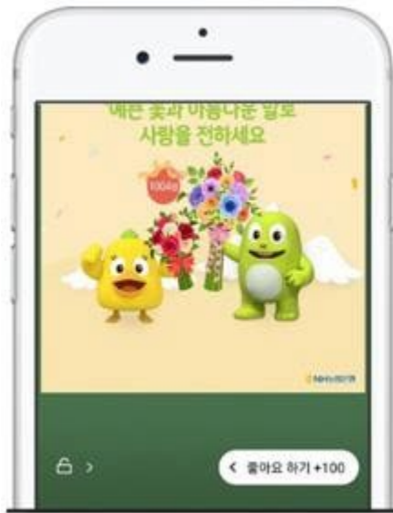
Lock Screen Type